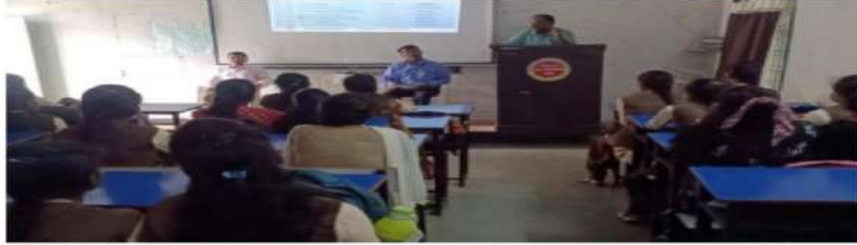
विदर्भ कल्याण / दारव्हा

नवसंजीवन शिक्षण प्रसारक मंडळ दारव्हा द्वारा संचालित जिजामाता कला महाविद्यालय येथील Electoral Literacy club (मतदार साक्षरता विभाग) ची स्थापना करून उद्घाटनाचा कार्यक्रम घेण्यात आला.