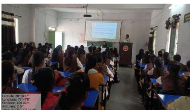
Skill development program for women