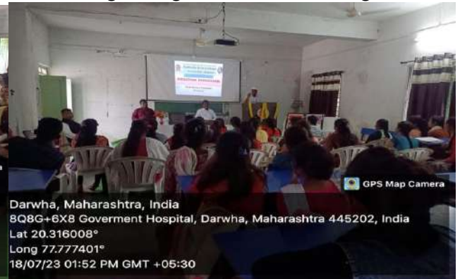
Program organized on women's rights