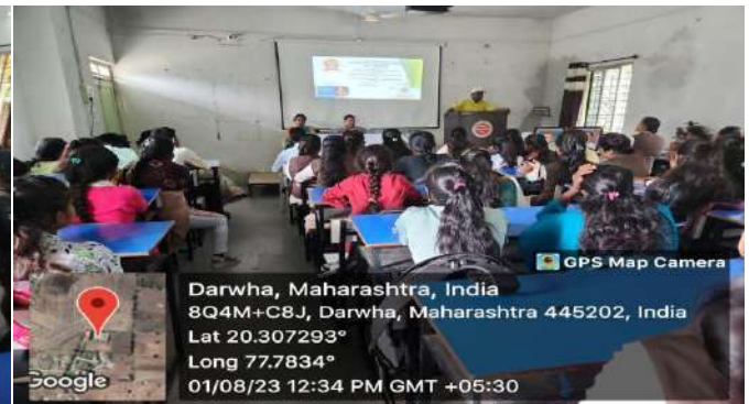
Program on women empowerment