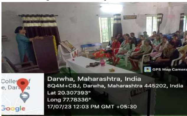
Program on women protection