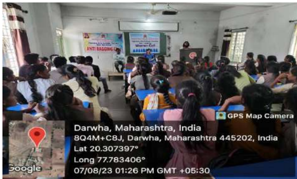
Anti ragging Awareness program