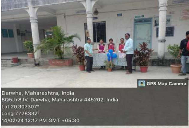
Program on earn and learn